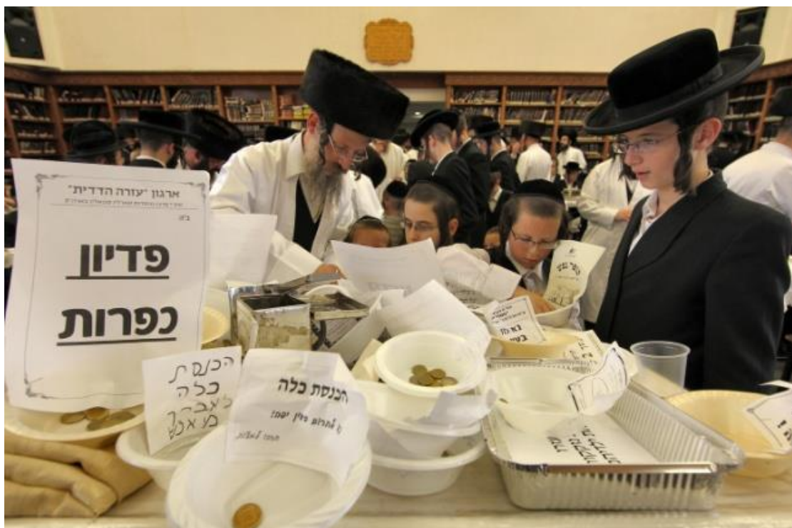
צדקה, אילוסטרציה

תגיות: התנדבות, המכון החרדי למחקרי מדיניות