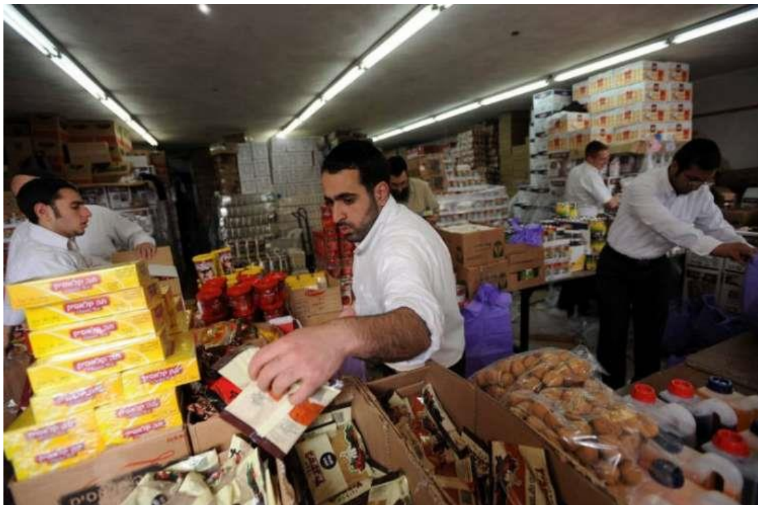
מתנדבים מתכוננים לחלוקת מזון לנזקקים

גבי שניידר | ו' אדר א' התשע"ט 12:55 | 11.02.19