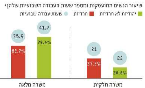
מקור: ביהמ"ד המרכזי לסקר, שירותי סטטיסטיקה, משרד העבודה והרווחה, לוי נתוני הלמ"ס