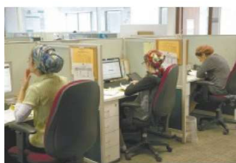
חברת טכנולוגיה באלעד למצלומת אין קשר לתוכן

החרדיות. מנתוני המחקר עולה כי העלאה של 10% בשכר השעתי תוסיף 0.5 שעות עבודה לאישה חרדית, לעומת 0.8 שעות עבודה לאישה לא-חרדית. במלים אחרות, חילוניות תעבוד יותר מחרדית עבור שכר גבוה יותר, אף שהאחרונה זקוקה יותר לתוספת השכר. "גם אותי הנתון הזה הפתיע בשלב ראשון, אבל מחקר איכותני העלה שאישה חרדית עושה מראש את המקסימום כדי לעבוד במסגרת המגבולות", אומרת קלינרסקי. "מסיבה זו, גם אם יעלו החרדיות את השכר, היא לא תמיד תוכל למוצא עוד שעות פנויות לעבודה. עם זאת, מעודדות של עובדות חרדיות נראה שאם השכר עולה באופן משמעותי, כמו בהייטק, החשיבה משתנה – כי הכסף הזה יכול לממן עוד מסגרת לילדים ולאפשר שעות עבודה נוספות. העלאה מינורית בשכר לא תשנה את מספר שעות העבודה, אבל העלאה שטר משמעותית כן."