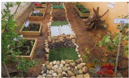
מאת: חיים גולדברג

'גן נעמי' של 'רשת הגנים' הוכרז גן החרדי המצטיין בארץ לשנת הלימודים תשע"ט. "הזכייה מוכיחה פעם נוספת את מה שידענו, כי ניתן להיות הטובים ביותר, החדשניים ביותר, וזאת מבלי לחרוג כמלוא נימה מהוראותיהם והכוונתם של מרנן גדולי ישראל על כל צעד ושעל"