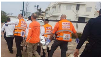
מאת: איציק גרוס

ימים של מתח ודאגה: ביום ראשון, יצא חנניה בר כוכבא מביתו לתפילת ערבית ומאז נעלמו עקבותיו • עם סגירת הגליון – אותר חנניה בחורשה